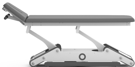
DIMENSIONES DEL PRODUCTO (cm)